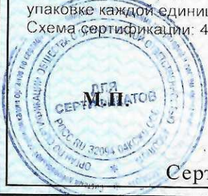
Схема сертификации: 4с

Сроки хранения (годности) указаны в прилагаемой к продукции товаросопроводительной документации и/или на упаковке каждой единицы продукции.